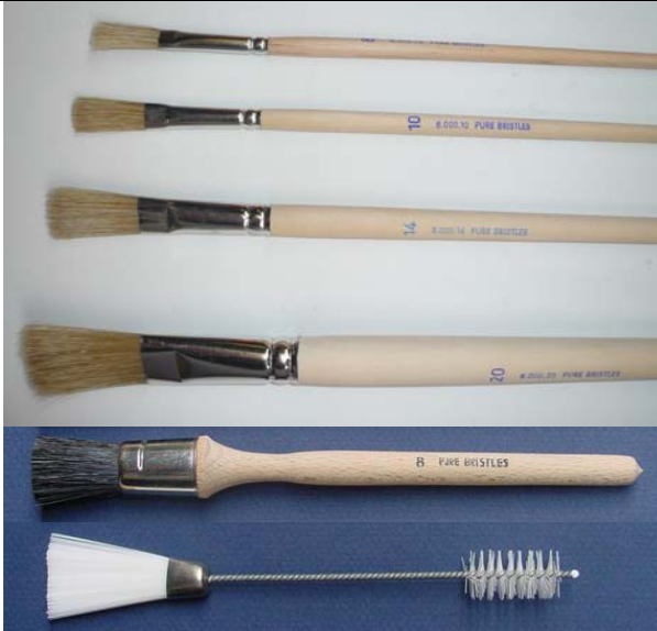
Borstel 8P Brosse 8P Bristle 8P Pinsel 8P - 021.020.060