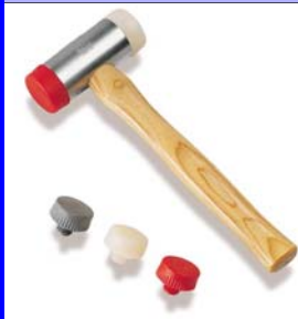
Hamer met plastiek kop Marteau à tête plastique Hammer with plastic head Hammer mit plastik Kopf 602/2 075.319.510