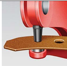
Revolvertang A Pince revolver Punch tool Revolver Lochzange (made in Germany) 026.481.002