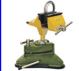
Bankvijs met zuignap Etau à ventouse Clamp Feinmechaniker Schraubstock 28602 075.228.602