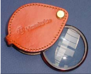
Vergrootglas Loupe Magnifier Einschlupfen 1117 075.319.540