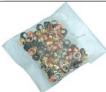
Tang voor ringen (met ringen) Pince pour œillets (avec œillets) Eyelet punch (with eyelets) Loch- und Ösenzange 026.482.000