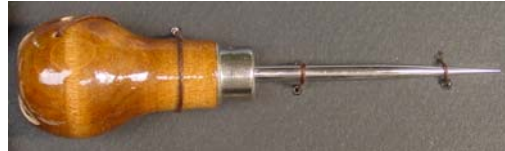
Prikpunt Poinçon Awl Pfriem HA3 075.313.060