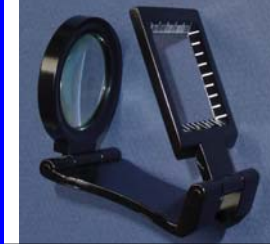
Draadtel/vergrootglas Compte fil/loupe Magnifier Fadenzähler UTC 3 075.319.550