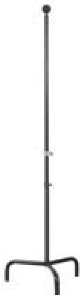
Staander voor paspop Bonna