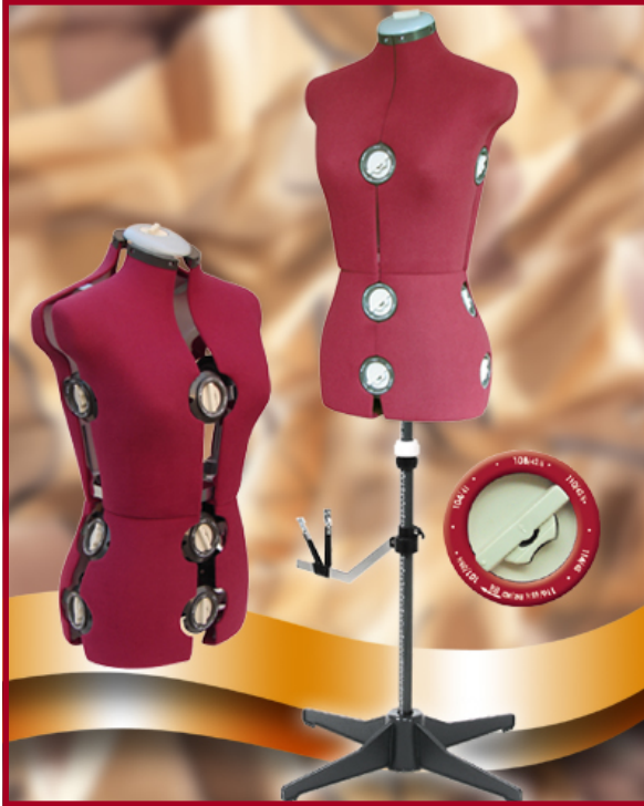
Ref. 150 Art. 077.000.150 - Ref. 151 Art. 077.000.151 Bordeaux / Marron / Maroon / Bordeaux