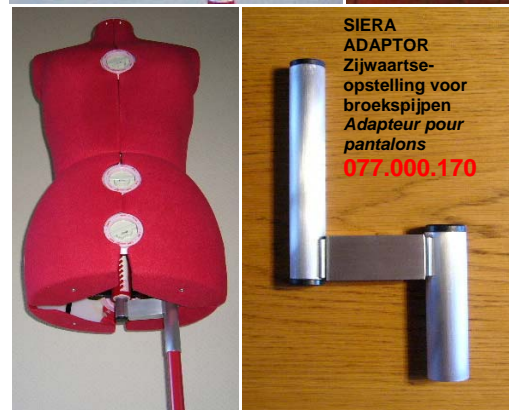
SIERA ADAPTOR Zijwaartse- opstelling voor broekspijpen Adapteur pour pantalons 077.000.170