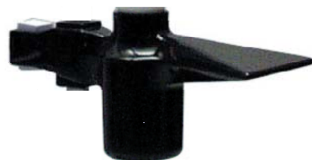
Verstuiver voor rokafronder 1113 Vaporisateur pour arrondisseur 1113 Vaporiser for skirt marker 1113 Zerstäuber für Rockabrunder 1113 073.600.200