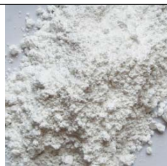
Poeder voor rokafronder - wit - 50 gr. Poudre pour arrondisseur - blanc - 50 gr. Powder for skirtmarker - white - 50 gr. Puderkreide für Rockabrunder - Weiß - 50 gr. 073.100.140