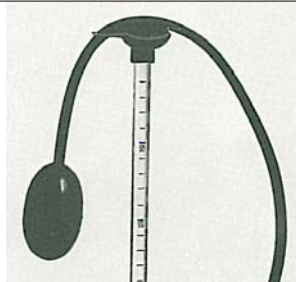
Peer/slang voor 1113 Poire/tuyau pour 1113 Pear/hose for 1113 Ball/Schlauch für 1113 073.600.210