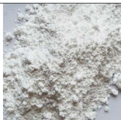
Poeder voor rokafronder - wit - 10 gr. Poudre pour arrondisseur - blanc - 10 gr. Powder for skirtmarker - white - 10 gr. Puderkreide für Rockabrunder - Weiß - 10 gr. 073.100.130