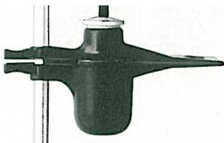
Verstuiver rokafronder 1111/1110 Vaporisateur arrondisseur 1111/1110 Vaporiser skirt marker 1111/1110 Zerstäuber Rockabrunder 1111/1110 073.600.205