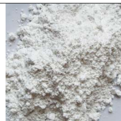
Poeder voor rokafronder - wit - 250 gr. Poudre pour arrondisseur - blanc - 250 gr. Powder for skirtmarker - white - 250 gr. Puderkreide für Rockabrunder - Weiß - 250 gr. 073.100.150